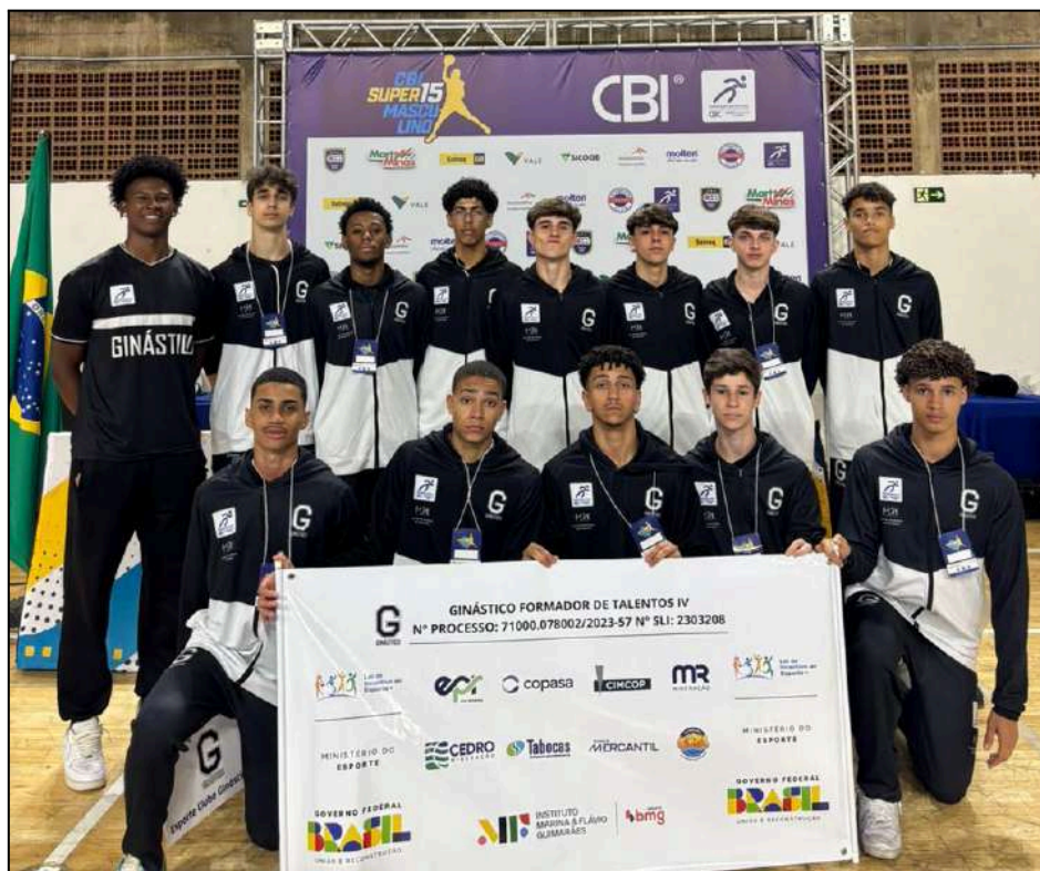
Equipe Sub-15. CBI Super 15 – Etapa Final - Olimpico Club - Belo Horizonte/MG.