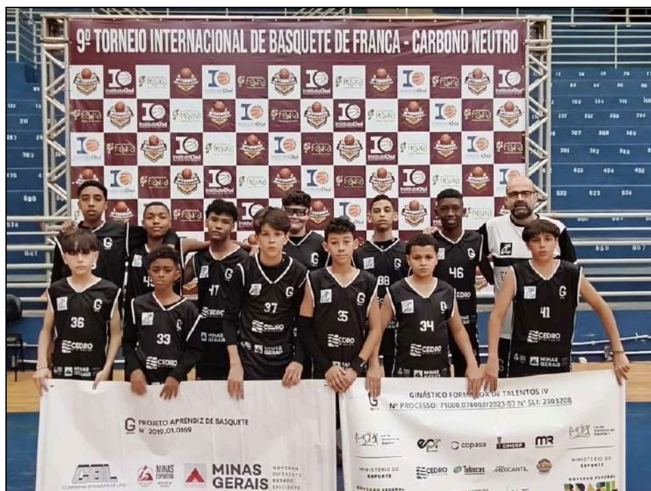
9º Torneio Internacional de Basquete de Franca.