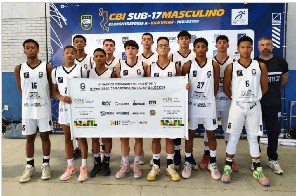
Equipe Sub-17. CBI 17 – Classificatória A - Sede IVV-CETAF - Vila Velha/ES.