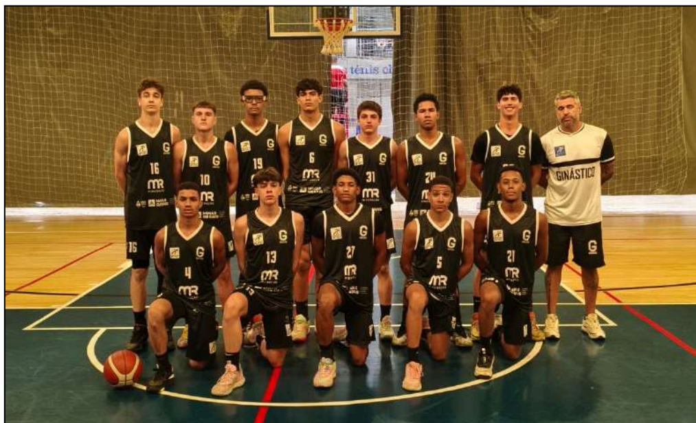
Equipe Sub 16. Jogo 102 Minas Tênis vs Ginástico