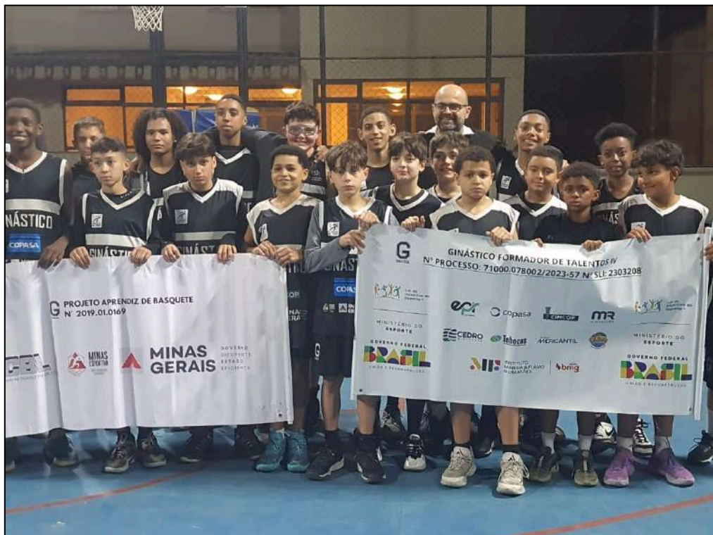
Equipe Sub 12. Jogo 69 Mackenzie vs Ginástico