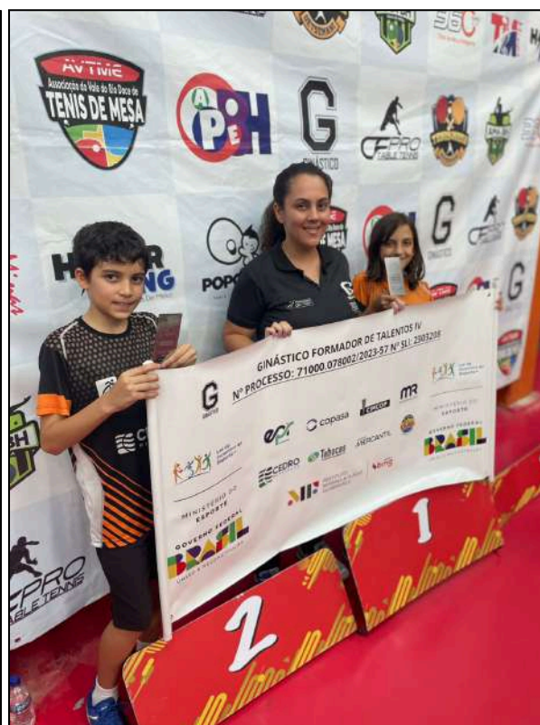
TMB Estadual - 1ª Etapa Campeonato Mineiro - 2025