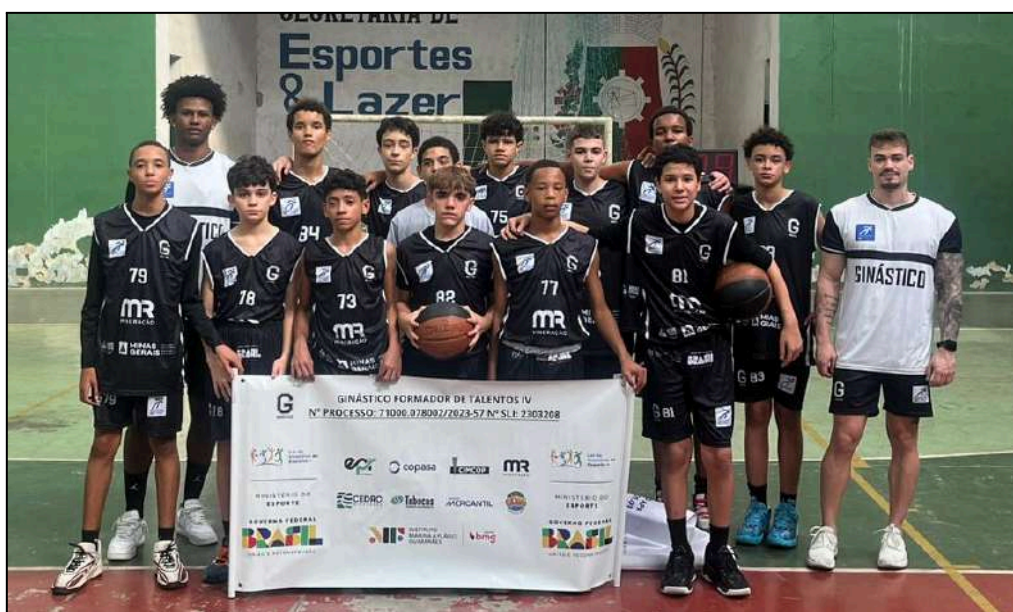
Equipe Sub 13. Jogo 74 ANBI Itaúna vs Ginástico