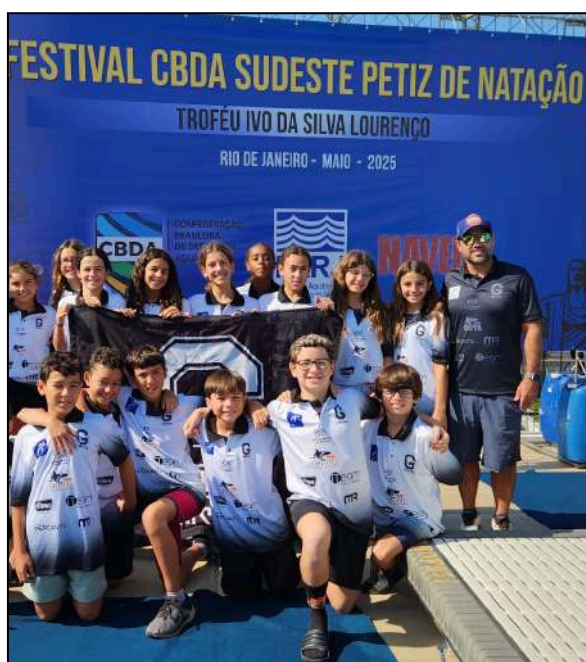
Festival CBDA Sudeste Petiz de Natação - 1º Semestre

Campeonatos Estaduais: No cenário de Minas Gerais, a equipe obteve destaque com as participações no Campeonato Mineiro Petiz de Inverno, no Campeonato Mineiro Pré-Mirim e Mirim (V Troféu Henrique Márcio) e, no encerramento do ciclo, no Campeonato Mineiro de Natação Mirim e Petiz ( Festival Mineiro de Natação Mirim e Troféu Fernanda Ferraz Petiz).