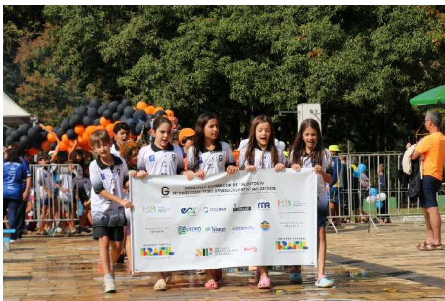
Campeonato Mineiro Petiz de Inverno

A modalidade de Tênis de Mesa obteve uma representação de excelência ao longo da temporada, competindo de forma regular nas principais etapas do circuito estadual e nos maiores eventos do calendário nacional integrado da modalidade: