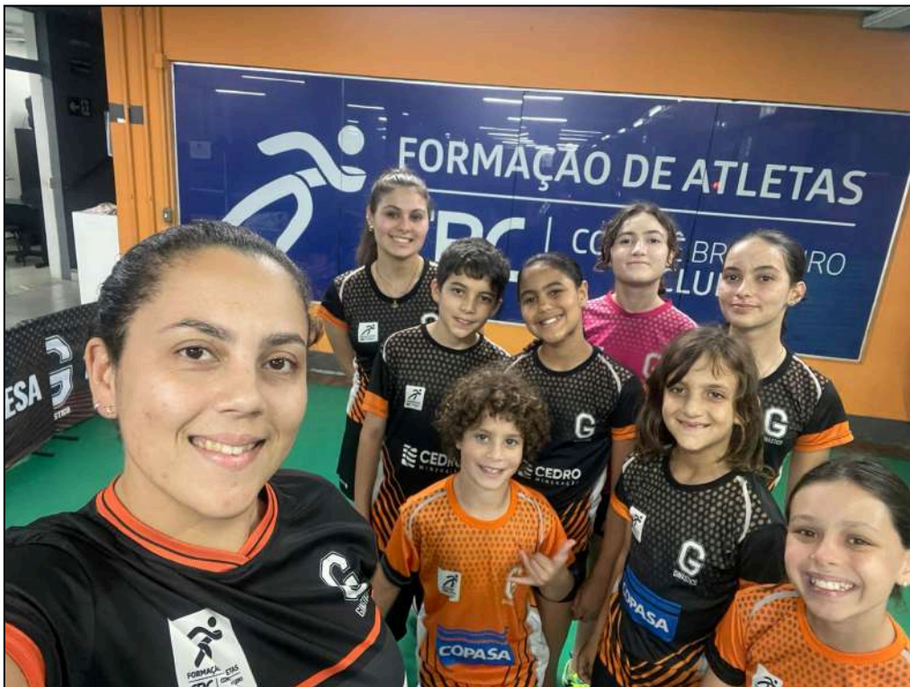
Equipe tênis de mesa