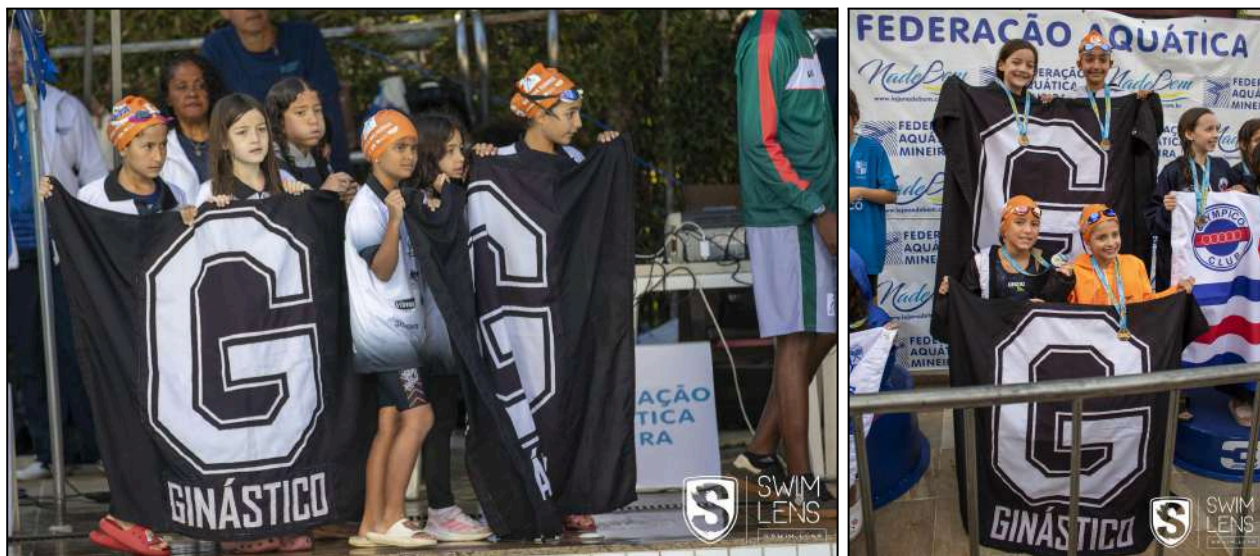
Campeonato Mineiro Pré Mirim e Mirim (V Troféu Henrique Márcio)