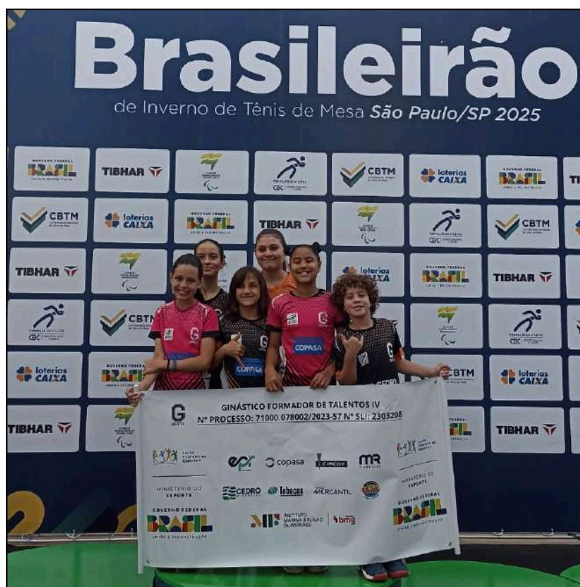
Brasileirão de Inverno Interclubes Olímpico e Paralímpico - 2025

Cenário Nacional (Brasileirões): Em nível máximo de competitividade, os atletas do projeto representaram a instituição nas duas principais janelas da Confederação Brasileira, participando tanto do Brasileirão de Inverno Interclubes Olímpico e Paralímpico 2025 quanto do Brasileirão de Verão Interclubes Olímpico e Paralímpico 2025.