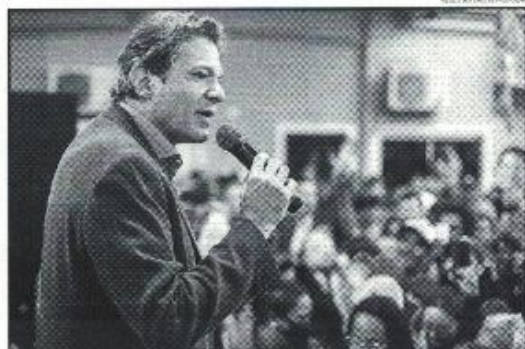
Fernando Haddad afirmou que manterá câmeras em uniformes de polícia, caso seja eleito no dia 30